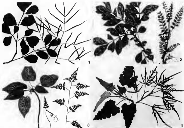
Pl. 2. — 1, Vitis mappia ; 2, Doratoxylon apetalum ; 3, Dombeya populnea ; 4, Ruizia variabilis . (Chaque espèce est représentée par un rameau adulte à gauche et juvénile à droite).